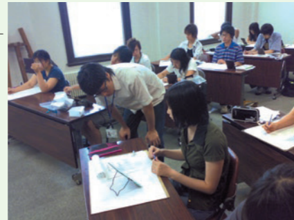
●毎年春(4月)・夏(7月)・冬(12月)に群馬県庁昭和庁舎で開催される「県庁デッサン講座」の様相