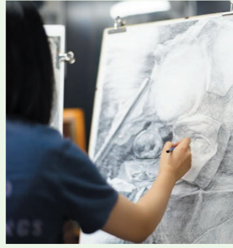
●「優秀参考作品展」では、デッサンデモンストレーションも行われる。